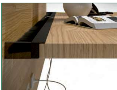
Rückwärtige Montage / Edge mounting