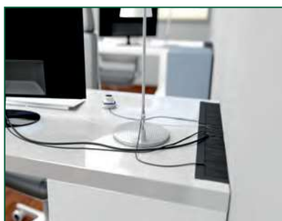
Flächenbündige Montage / Flush mounting